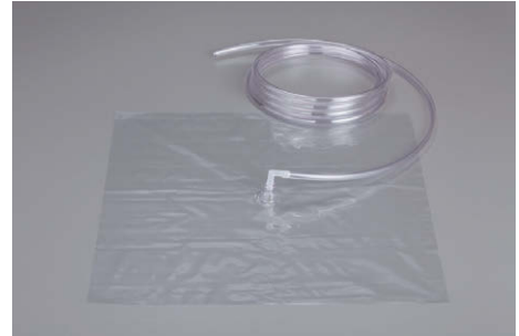
※ホースはオプションです (内径 9mm/ 外径 11mm)