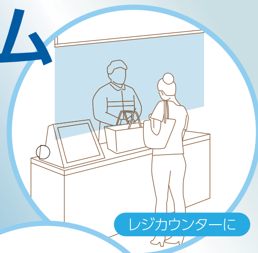
レジカウンターに